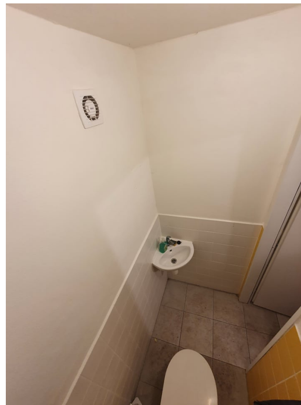
Rekonstruovaný záchod v klubovně